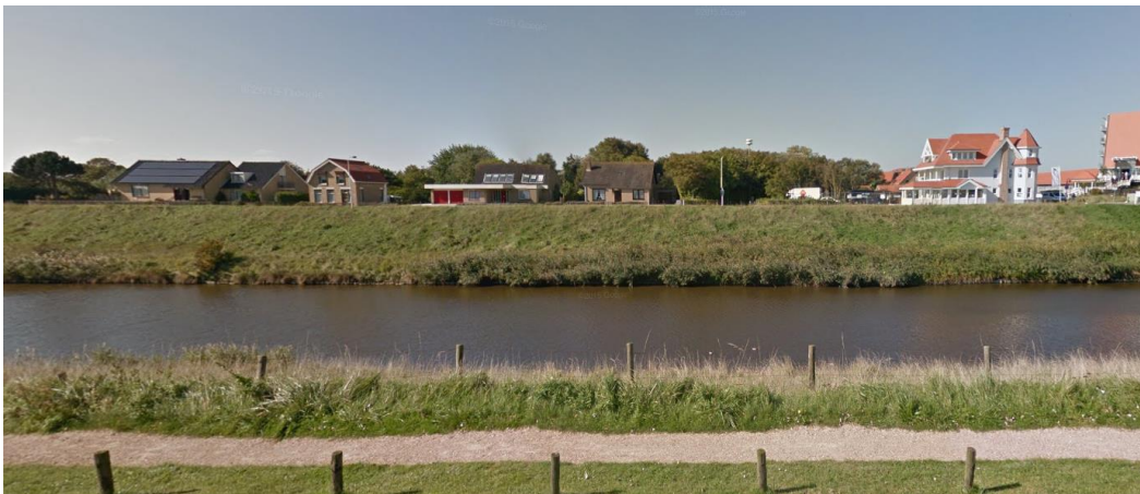
Bestaande situatie Kanaalweg 1a t/m 5 met uiterst rechts de badplaatsvilla op de hoek van de Noordzeestraat.

Het dubbele woonhuisvolume met huisnummers 4 en 5 kan, al dan niet gefaseerd, als één geheel herontwikkeld worden. De bebouwing op deze locatie zal zich dan in schaal en maat moeten voegen in het ensemble dat hier zal ontstaan. Overigens hoeft een herontwikkeling met twee kleinere vrijstaande volumes niet uitgesloten te worden.