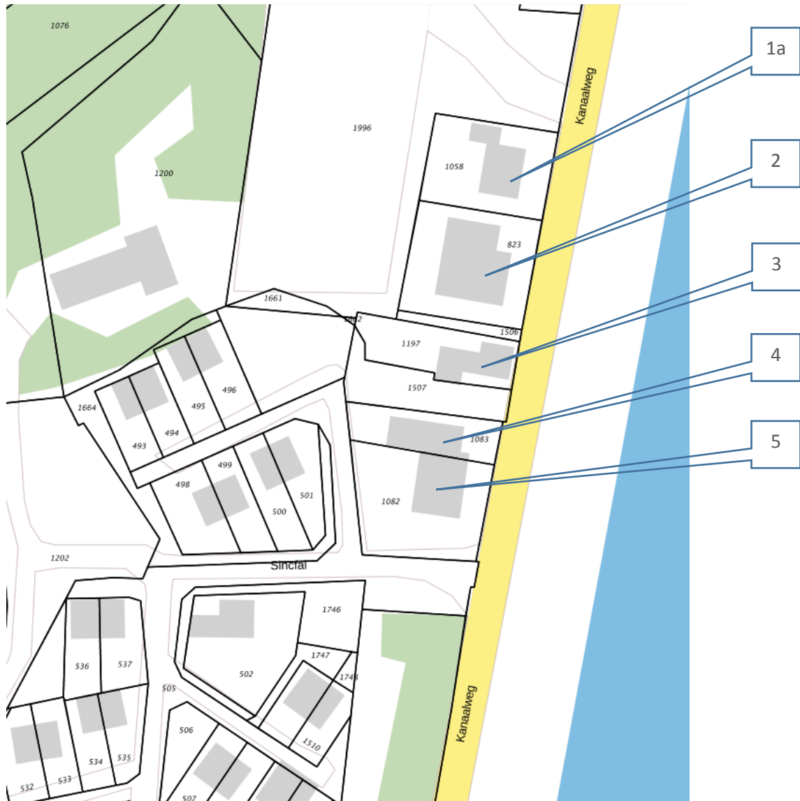
Kadastrale percelen en huisnummers

Per kavel(groep) is hierna het ontwikkelkader aangegeven. De ontwikkelmogelijkheden zijn afgestemd op onderstaande kavelgroottes: